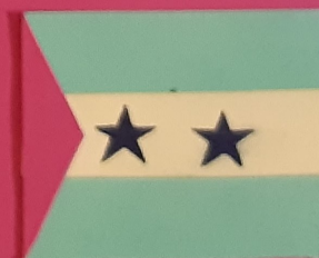
São Tomé e Príncipe