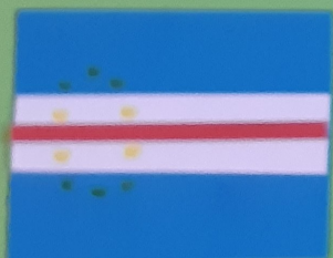
Cabo - Verde