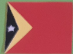
Timor - Leste